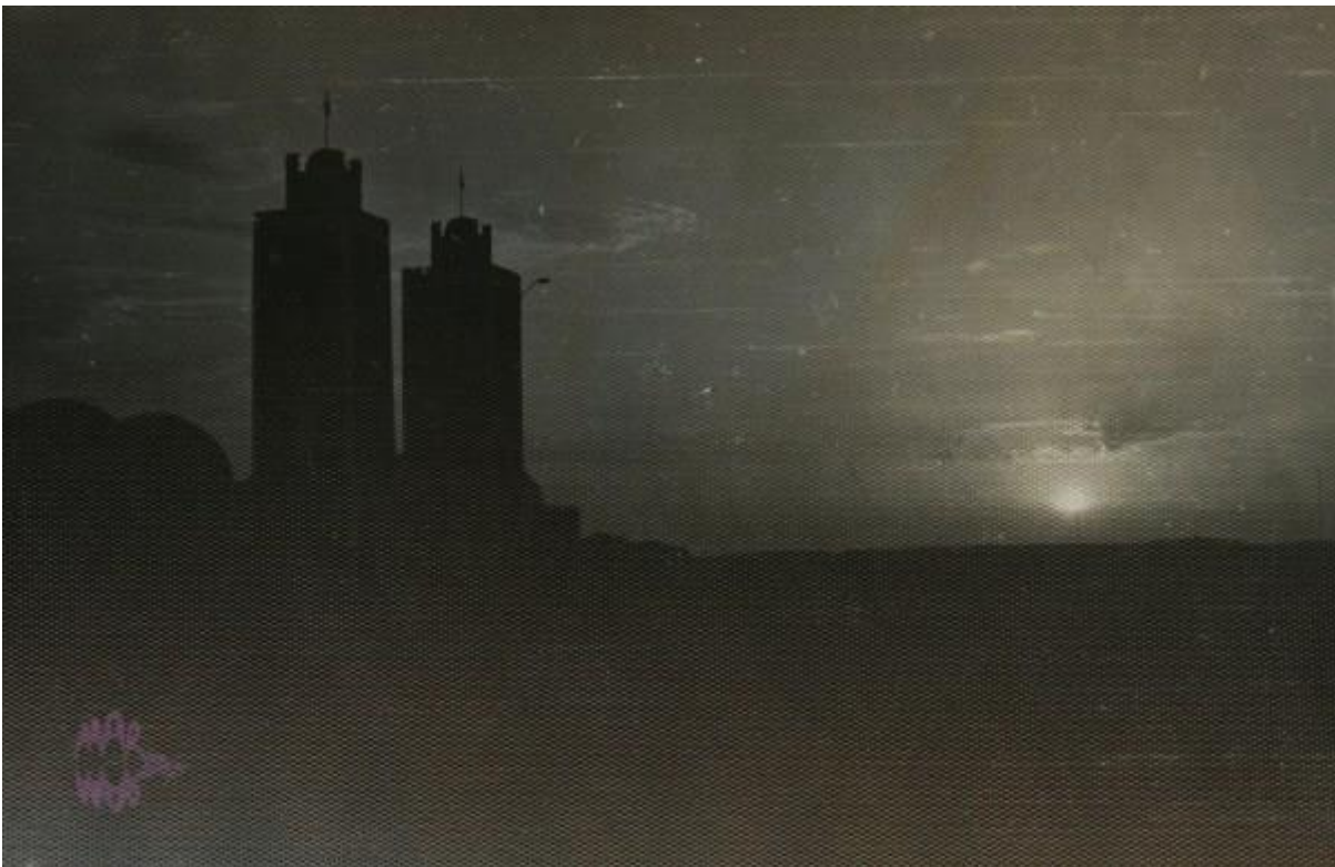
entrada cuartel de SMARA

No recuerdo bien, pero es probable que estas personas sentadas allí, fueran compañeros Saharauis del cuartel, pues en Tropas Nómadas había soldados que eran de allí, de hecho eran ellos los guías de las patrullas que salían al desierto, pues EL DESIERTO es el patio de su casa.