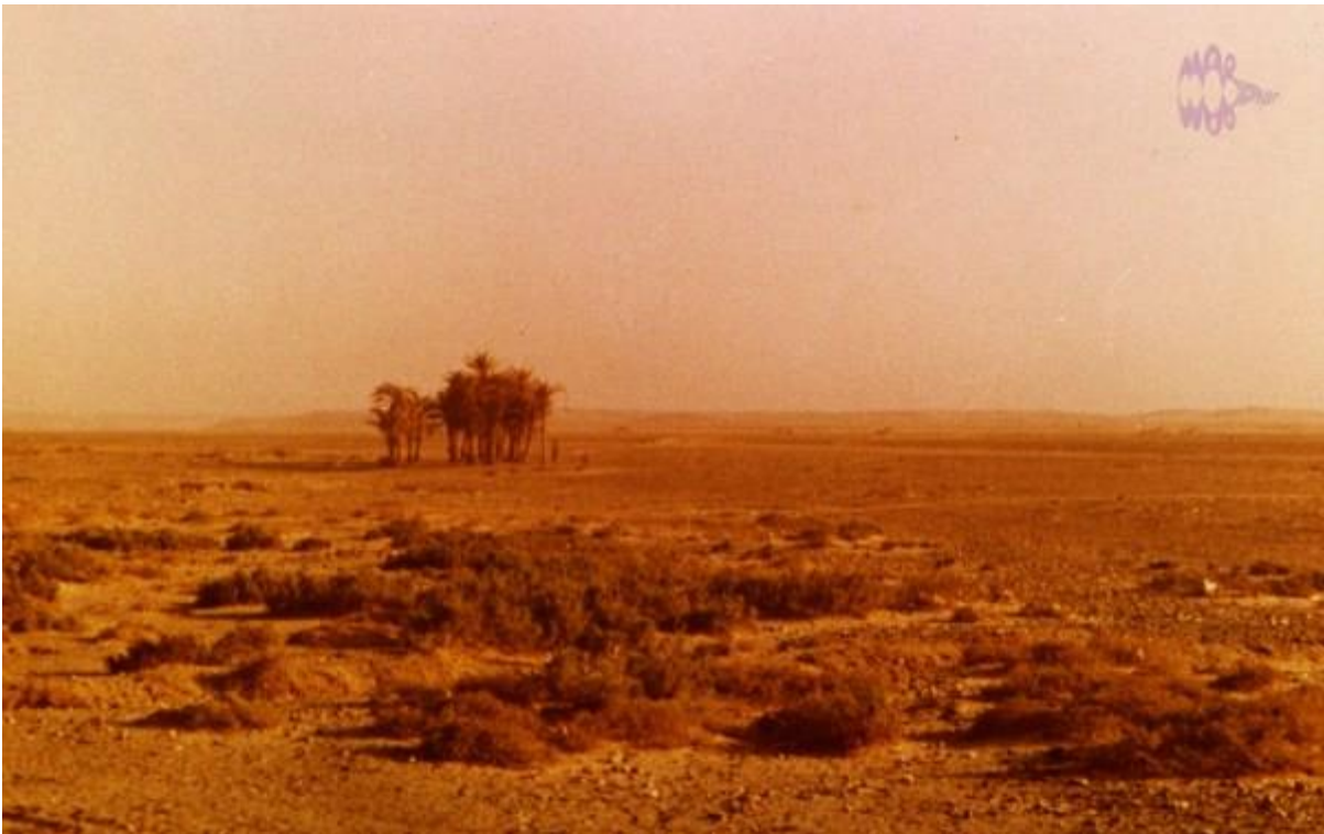
Pozo yendo al aeródromo

Estas palmeras en mitad de la nada eran la manifestación exterior de que en el subsuelo había agua, era el único punto vertical que encontrabas en el trayecto hasta el aeródromo, y naturalmente te hacía volver la mirada hacia él.