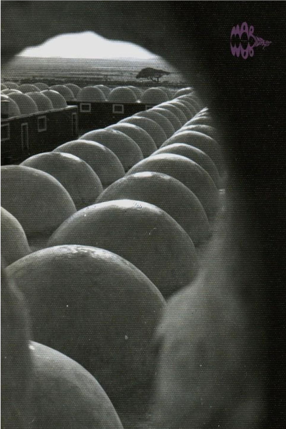
TEJADOS CUARTEL TROPAS NOMADAS

Aquí estuve destinado durante, más o menos mes y medio, que resultó ser en mitad del verano con lo que me enteré muy, pero que muy bien lo que eran 50 grados a la sombra, y como era una odisea cualquier cosa que pretendieses hacer entre las 12 y las 17 horas de la tarde.