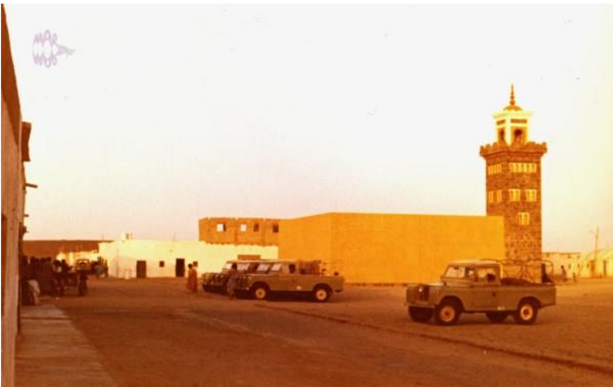
Mezquita nueva de Smara

Estas palmeras en mitad de la nada eran la manifestación exterior de que en el subsuelo había agua, era el único punto vertical que encontrabas en el trayecto hasta el aeródromo, y naturalmente te hacía volver la mirada hacia él.