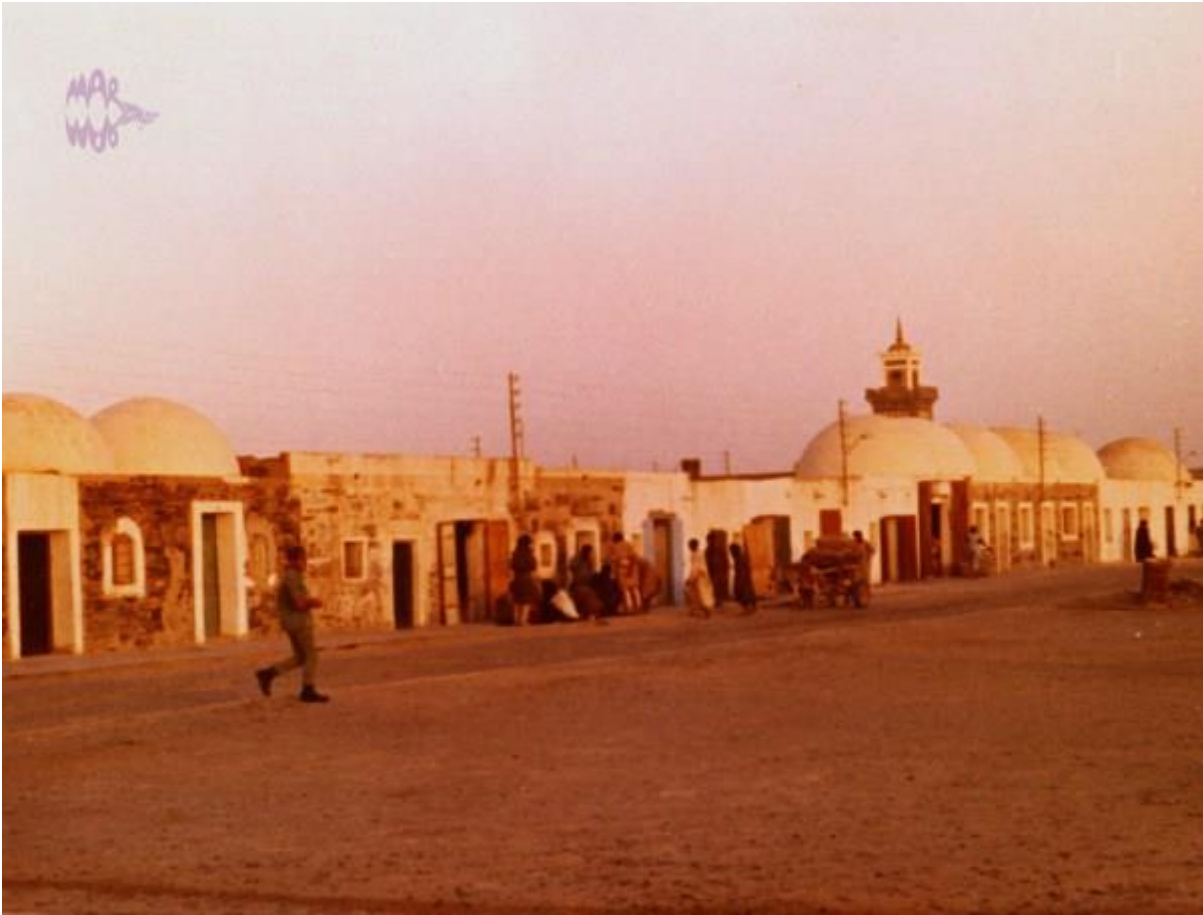
Plaza mayor de Smara

Los paseos por la ¿Ciudad? se terminaban casi siempre en la Plaza Mayor, como no había grandes tiendas, ni " Shopping center " Pero podías encontrar a algún sastre, con su máquina de coser de aquellas, ALFA, SINGER, o similares en su pequeña tienda, algún artesano de cuero, o de plata, pues de este material hacían unas piezas muy interesantes.